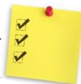
TABLEAU SYNTHÈSE FRAIS DU SERVICE DE GARDE