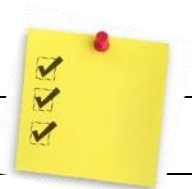
TABLEAU SYNTHÈSE FRAIS DU SERVICE DE GARDE

Un enfant peut se voir retirer le droit de fréquenter temporairement le service de garde ou en être exclu pour toute raison jugée valable par la direction comme le non-paiement par les parents des services facturés, le comportement inadéquat de l'enfant, des gestes de violence reconnus ou autres motifs.